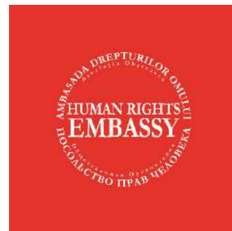
Human Rights Embassy