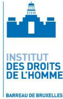
Institut des droits de l'homme du barreau de Bruxelles