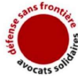
Avocats solidaires – Défense sans frontières