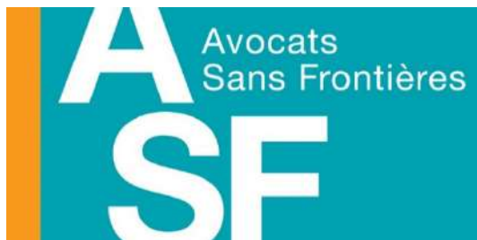
Avocats sans Frontières (Belgique)