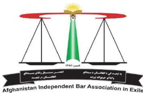
Afghanistan Independent Bar Association In Exile (AIBAIE)