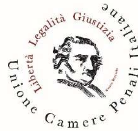
Unione delle Camere Penali Italiane Union of the Italian Criminal Chambers