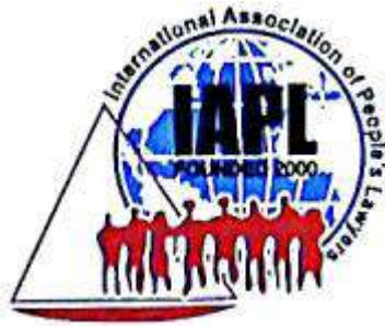
International Association of People's Lawyers (IAPL)